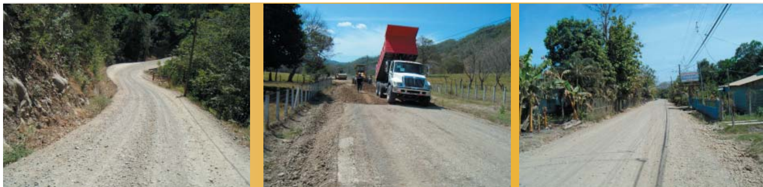
Trabajos realizados en Paquera

La primera de las rutas entregadas, Cruce de San Pedro-La Tigra de 3 km, pertenece al distrito de Lepanto, y los otros tres que se ubican en el distrito de Paquera son: Embarcadero- Punta Cuchillos (2.6 km), Paquera-Estero Órganos (1.6) y Santa Cecilia-San Rafael con 5.6 km.