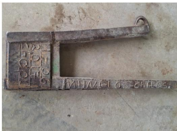
Imagen 1. Gancho municipal utilizado para manipulación de alcantarillas