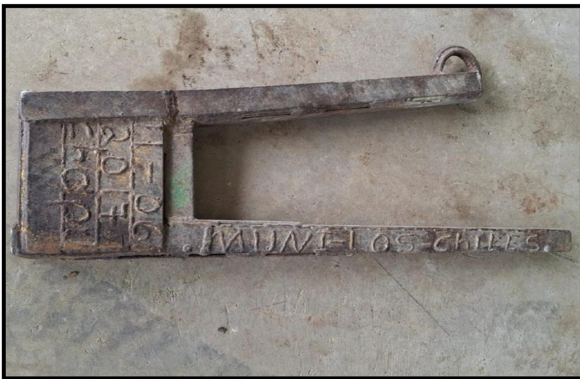
Imagen 1. Gancho municipal utilizado para manipulación de alcantarillas

Siguiendo las recomendaciones establecidas en el Boletín citado, se utiliza un gancho tipo c, para la manipulación de alcantarillas: