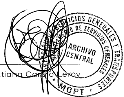
Tatiana Carpio Lezoy

Firmamos al ser las 10:00 horas del viernes 20 de junio de 2025