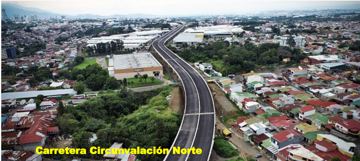
Carretera Circunvalación Norte