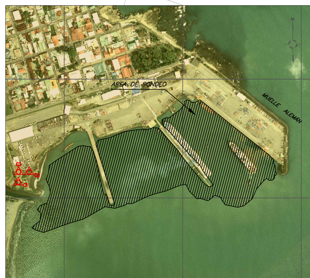
UBICACIÓN EN SITIO ORTOFOTOS 3545-I-NE-4 Y 3545-I-NE-5, DEL PROYECTO DE REGULARIZACIÓN CATASTRO Y REGISTRO ESCALA 1:10.000

FECHA DEL LEVANTAMIENTO BATIMÉTRICO: 26 Y 29 DE NOVIEMBRE DE 2018. RECOLECCIÓN Y PROCESAMIENTO DE LA INFORMACIÓN MEDIANTE EL USO DEL SOFTWARE HYPACK 2015. ÁREA APROXIMADA DEL LEVANTAMIENTO BATIMÉTRICO: 27 HECTÁREAS. LANCHAS Y OPERADOR APORTADOS POR SERVICIO NACIONAL DE GUARDACOSTAS. LEVANTAMIENTO DE TIERRA Y CONTORNO DE COSTA: DETALLES EN TIERRA A PARTIR DE ORTOFOTOS DEL PROGRAMA DE REGULARIZACIÓN DE CATASTRO/REGISTRO, BANCOS DE NIVEL ACTUALIZADOS SEGÚN CUADRO INDICADO CURVAS DE NIVEL CALCULADAS A PARTIR DE LA TOTALIDAD DE LOS PUNTOS DE LA BATIMETRÍA Y NO A PARTIR DE LA MALLA DE PUNTOS GENERADA.